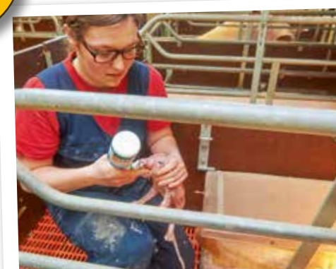
Energieshot voor lichte biggen